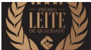
Produtores santanenses recebem o “Premio Leite de Qualidade”