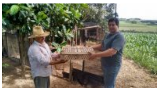
Primeira etapa da entrega de pintinhos é realizada com sucesso.