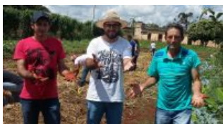
Produtores visitam NEAT